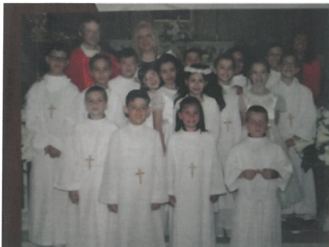
Foto di Gruppo Prime Comunioni 2017 In alto a Sinistra a S. Maria Assunta di Serra - 28 Maggio; Sopra: Santi Cornelio e Cipriano - 11 Giugno; Di fianco a sinistra: N. S. della Mercede - 4 Giugno