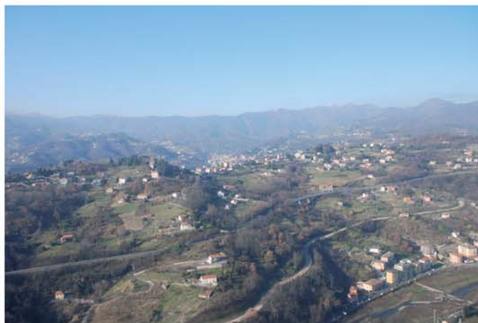
Veduta dall'alto di Serra Riccò - Castagna in basso a destra

Castagna è legata ad una grande famiglia dell'aristocrazia genovese, i Negrotto Cambiaso che vi possedevano, sulla sinistra del Secca, una bellissima villa del XVII secolo , con una cappella gentilizia e l'annesso cimitero di famiglia. Nella villa, oggi in rovina, negli anni venti del Novecento visse lo scrittore italo-inglese Jack Donghi che vi ambientò il racconto (in lingua inglese) Uno più uno uguale uno . Oggi parte della costruzione è stata riutilizzata per la costruzione degli spogliatoi di un campo di calcio sul quale gioca la squadra locale A.S.D. Serra Riccò. Castagna è sede della P.A. Croce Bianca Val Secca, della locale stazione dei Carabinieri e di una scuola elementare intitolata ad Anna Frank .