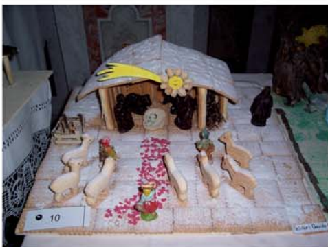
Presepe fatto da Davide Pelissa 3° Classificato