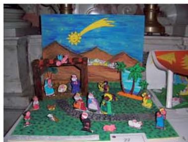
Presepe fatto dai bambini del catechismo di terza elementare