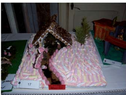
Presepe fatto da Francesco Di Giampaolo