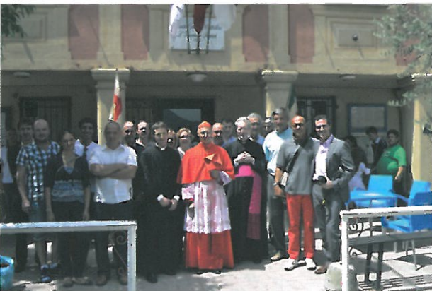
Festa San Vincenzo Ferreri