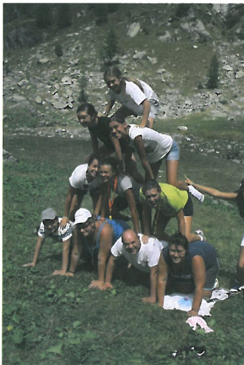
Campo Mercede - Pianetto 2012