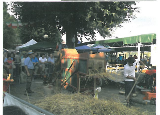
Festa dei Santi 'Titolari' dei Genovesi