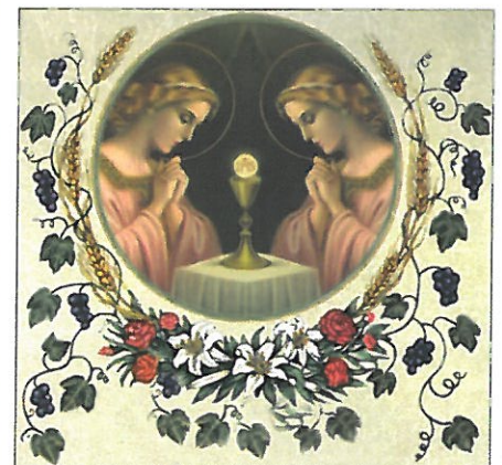
Santi Cornelio e Cipriano