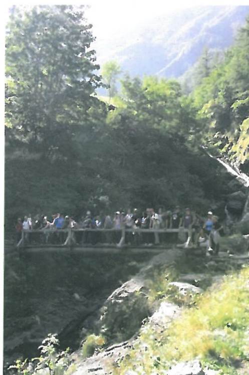
Campo Les Combes 2012