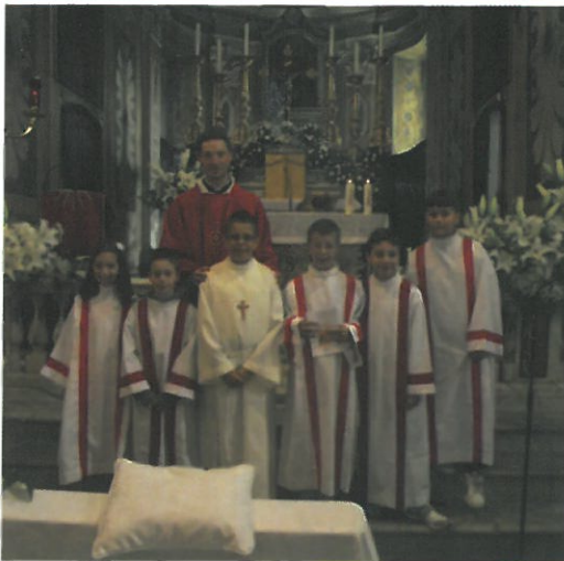
Santa Maria Assunta di Serra