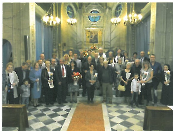
Festa Anniversari di Matrimonio 7 ottobre

Sabato 12 Gennaio 2013 Sabato 2 Febbraio 2013 Sabato 2 Marzo 2013 Sabato 6 Aprile 2013 Sabato 4 Maggio 2013