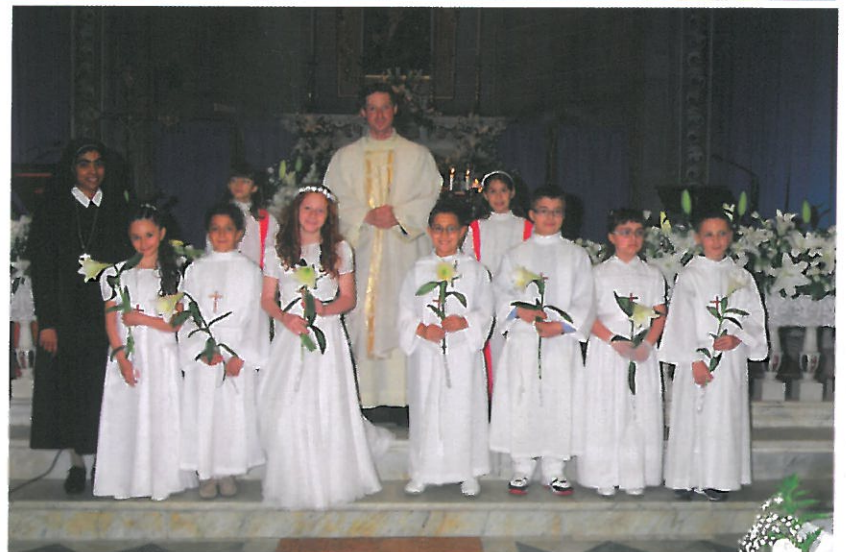
N.S. della Mercede in Mainetto