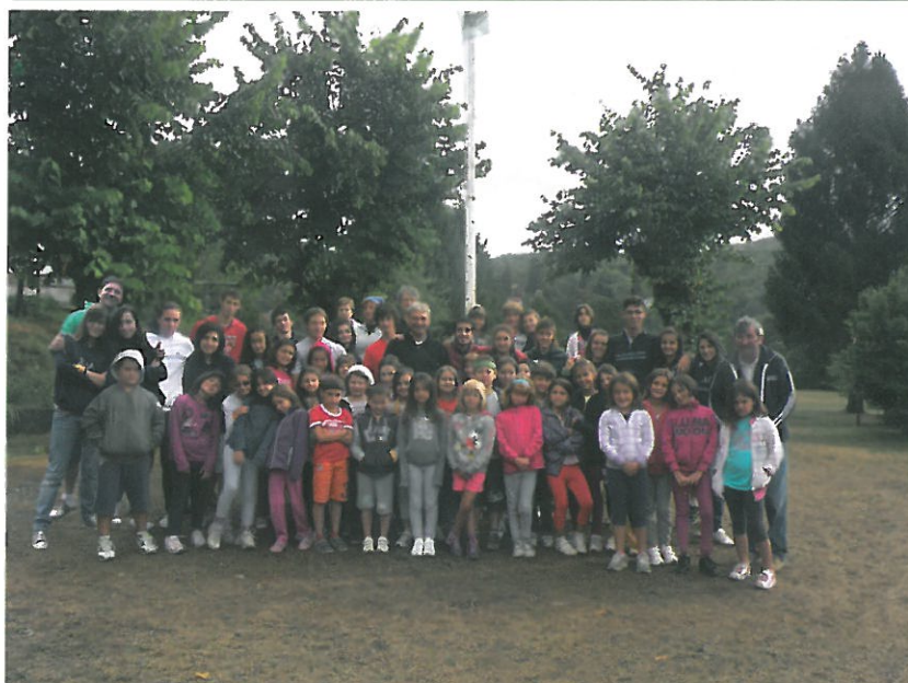
Campo Torriglia 2012