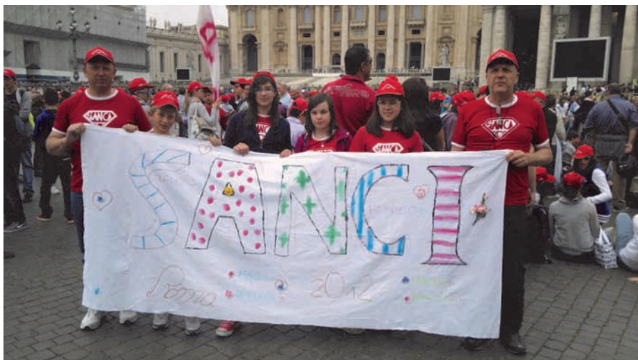
Gruppo San Cipriano

Dal 18 al 20 Maggio si è svolto l'annuale pellegrinaggio dei Cresimandi della nostra diocesi a Roma. Hanno partecipato anche alcuni dei nostri ragazzi di Mainetto, che hanno ricevuto la Cresima il 1° Maggio, e alcuni di San Cipriano che la riceveranno domenica 2 dicembre