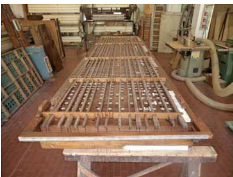
Pettini del Somiere del Grande Organo

Proprio in questi tempi, a seguito di incontri tenuti con i titolari della ditta incaricata, sono emersi particolari a molti sconosciuti. L'organo, costruito da Gaetano Cavalli di Lodi nel 1910 opera n° 410, come testimoniano alcuni documenti dell'epoca, risulta decisamente di grande valore artistico e tecnico; sicuramente importante e "corale" fu la partecipazione degli abitanti di San Cipriano che permise all'epoca di realizzare uno strumento significativo anche per quanto riguarda la decorazione della cassa e tribuna (che venne opportunamente ingrandita per ospitare il nuovo organo). Tanto per dare l'idea, trascivo alcune descrizioni riportate in sede di offerta dalla ditta che ne cura il restauro.