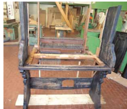
Consolle in fase di restauro

Proprio per mantenere intatta la qualità, la bellezza dell'opera ed il suo valore artistico, il restauro mira al consolidamento e alla ristrutturazione fedelissima all'originale. Tutto questo, anche se comporta un grande sforzo economico, lo dobbiamo alla parrocchia e ai nostri avi.