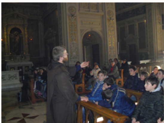
Gita Catechismo ad Arenzano - fine dicembre 2013